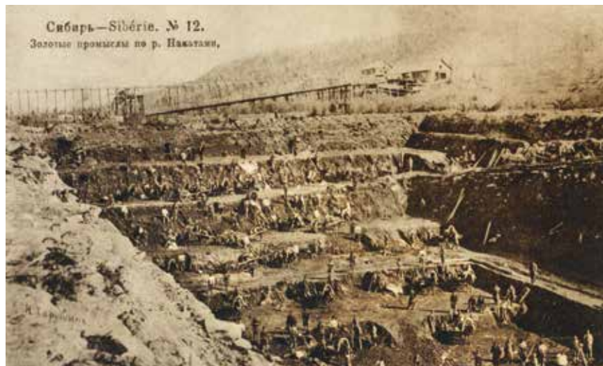
Золотые промыслы по р. Накатами Ленского горного округа. Почтовая открытка. Начало XX века